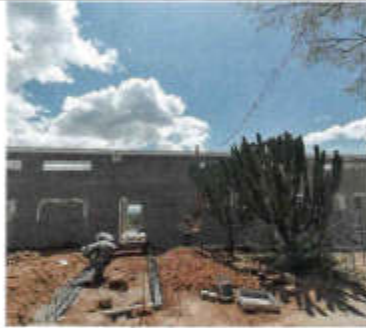
F0. PUEBLAMIENTO DE BARRIGAS TRAPEZOIDALES DE CONCRETO PARA UN COLUMNA