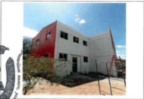
EL BARRIDO Y APLICACIÓN DE PINTURA BLANCA Y TINTES EN ROJO, ACABADO DEFINITIVO, BASE PARA LA OBRAS DE ACABOS INTERIORES

Observaciones: OBRA ADJUDICADA MEDIANTE LICITACIÓN PÚBLICA ESTATAL. Se encuentran trabajando en pintura, excavación para tendido de tubería conduit, cimentación de ampliación de I-line.