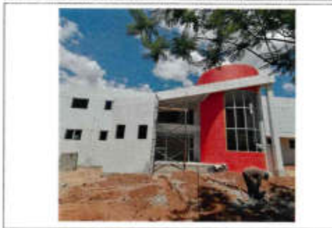
EL APLICACIÓN DE GUARNICIÓN TERMOACÚSTICA DE CONCRETO PUERTO CERRADO