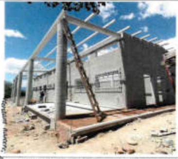
F2. CONCRETO SIMPLE DE PÓLVO FORTALECIDO CON MALLA ELECTROREJALADA, ALABADO MANEJO CON BARRIL