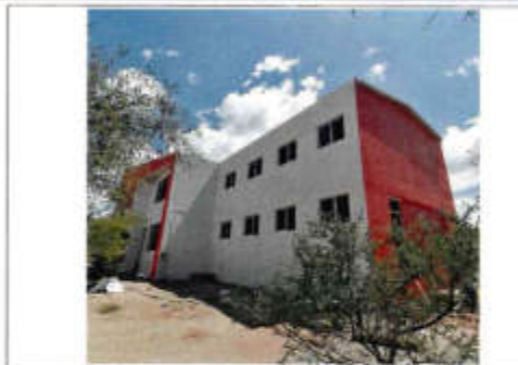
EL BARRIDO Y APLICACIÓN DE PINTURA BLANCA Y TINTES EN ROJO, ACABADO DEFINITIVO, BASE PARA LA OBRAS DE ACABOS INTERIORES

Observaciones: OBRA ADJUDICADA MEDIANTE LICITACIÓN PÚBLICA ESTATAL. Se encuentran trabajando en pintura, excavación para tendido de tubería conduit, cimentación de ampliación de I-line.