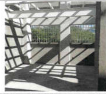
F4. FORME DE CONCRETO DOBLE DE PÓLVO CON REFORZADO CON MALLA ELECTROREJALADA