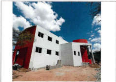
EL BARRIDO Y APLICACIÓN DE PINTURA BLANCA Y TINTES EN ROJO, ACABADO DEFINITIVO, BASE PARA LA OBRAS DE ACABOS INTERIORES