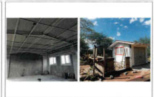
EL BARRIDO Y COLOCACIÓN DE FALDA PLÁTICA, BARRIDO Y COLOCACIÓN DE LONETA 14.00, BARRIO CERRADO Y TENDIDO DE TUBERÍA CONDUIT DE 11 CM. CESTILLOS DE CONCRETO PARA BARRIO TENDIDO DE 11.0 CM.

Universidad de la Cañada DEPARTAMENTO DE PROYECTOS, CONSTRUCCIÓN Y MANTENIMIENTO