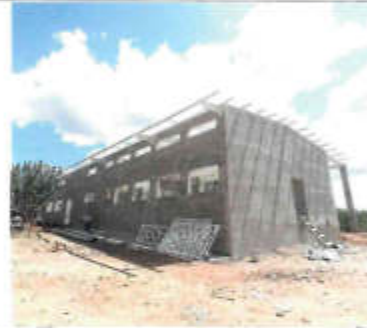
F1. BARRIDO Y COLACIÓN DE PROTECCIÓN METÁLICA PARA REFORZAR CON MALLA CAPAZADA DE 12"