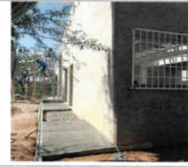
F3. BARRIDO DE CONCRETO PO-ESTRUCO DE 12 CM DE ESPESOR REFORZADO CON MALLA ELECTROREJALADA